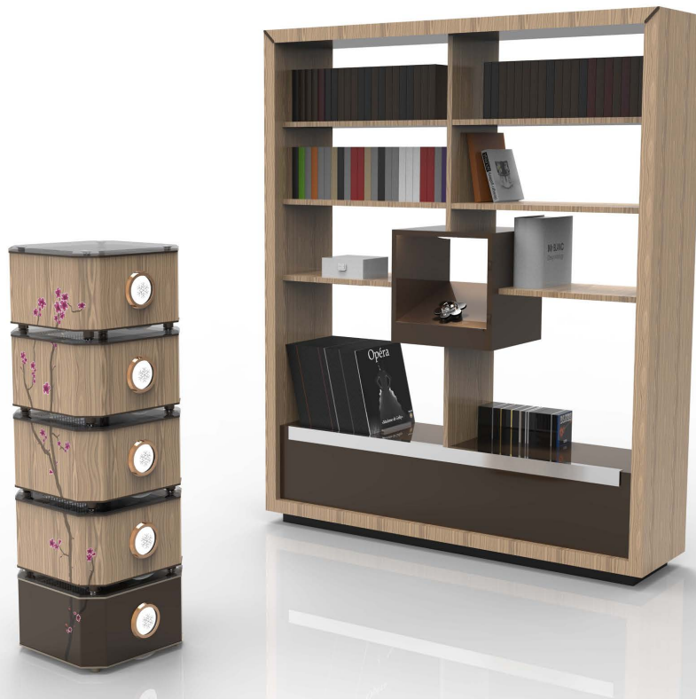
«Cerisiers du Japon» designed by Olivier Blanc for APURNA™ création

Laissez-vous transporter par les « Cerisiers du Japon » très «Nature» ou par le «Carbone & Titanium» inspiré des sports mécaniques.