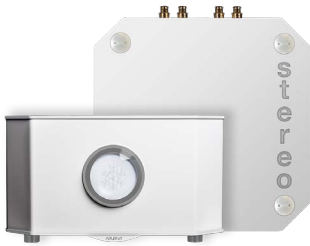
BLANC PUR | PUR WHITE RAL 9010