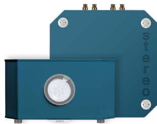
BLEU AZUR | AZURE BLUE RAL 5009