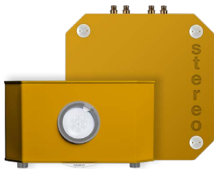
JAUNE MIEL | HONEY YELLOW RAL 1005