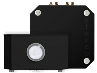
NOIR FONCÉ | JET BLACK RAL 9005