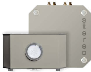
GRIS SOIE | SILK GREY RAL 7044